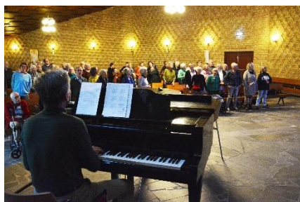
'Speel en Zing mee'-middag.