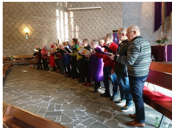
Kerstbijeenkomst met vrijwilligers en bestuur van het Toon Hermans Huis Amersfoort.

Voor de 'Speel en Zing mee'-bijeenkomst kregen we, samen met Ithaka en het THHA, subsidie van de gemeente Amersfoort en St. Kanker in Beeld. Daarnaast hebben we ook nog steeds een trouwe schare donateurs, vrienden en (oud-)koorleden die ons steunen met kleinere en grotere bedragen. Daar zijn we uiteraard heel blij mee.