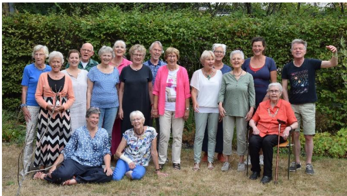
Poseren voor een foto voor de nieuwe flyer.

Verschillende mensen kwamen via ons gezamenlijk optreden in de Fonteinkerk met Ithaka (Spelen voor je Leven Amersfoort) en het Toon Hermans Huis Amersfoort op 13 november jongstleden in het kader van het 25-jarig bestaan van de stichting Kanker in Beeld (waarover hierna meer).