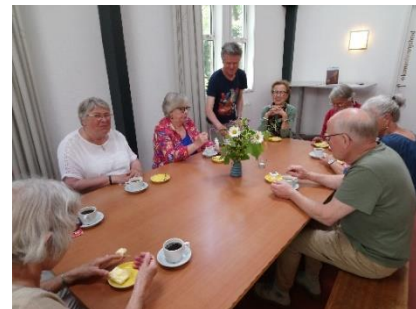
De jubileumgebakjes t.g.v. 25 jaar KiB.