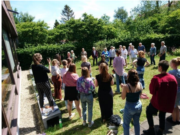
In de pauze samen zingen met het Nationaal Vrouwen Jeugdkoor.